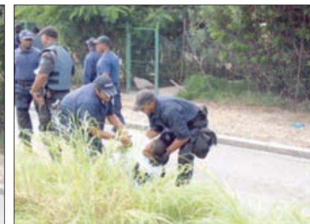
Detencion di otro manifestante di grupo Wiels